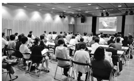
(熱心に聞き入る会員)