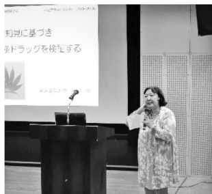
(畑中会長より挨拶)

学校薬剤師として防煙教育・薬物乱用防止教室・エピペン研修会・各種環境衛生検査への造詣の重要性などを改めて感じた研修会でした。